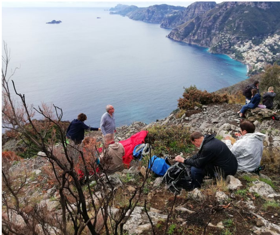
Wanderwoche in Praiano an der Amalfiküste