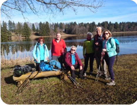
Am Lugensee, bayr. Voralpen