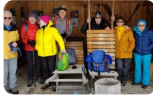
Winterwanderung Geizenmoos, Ammergebirge