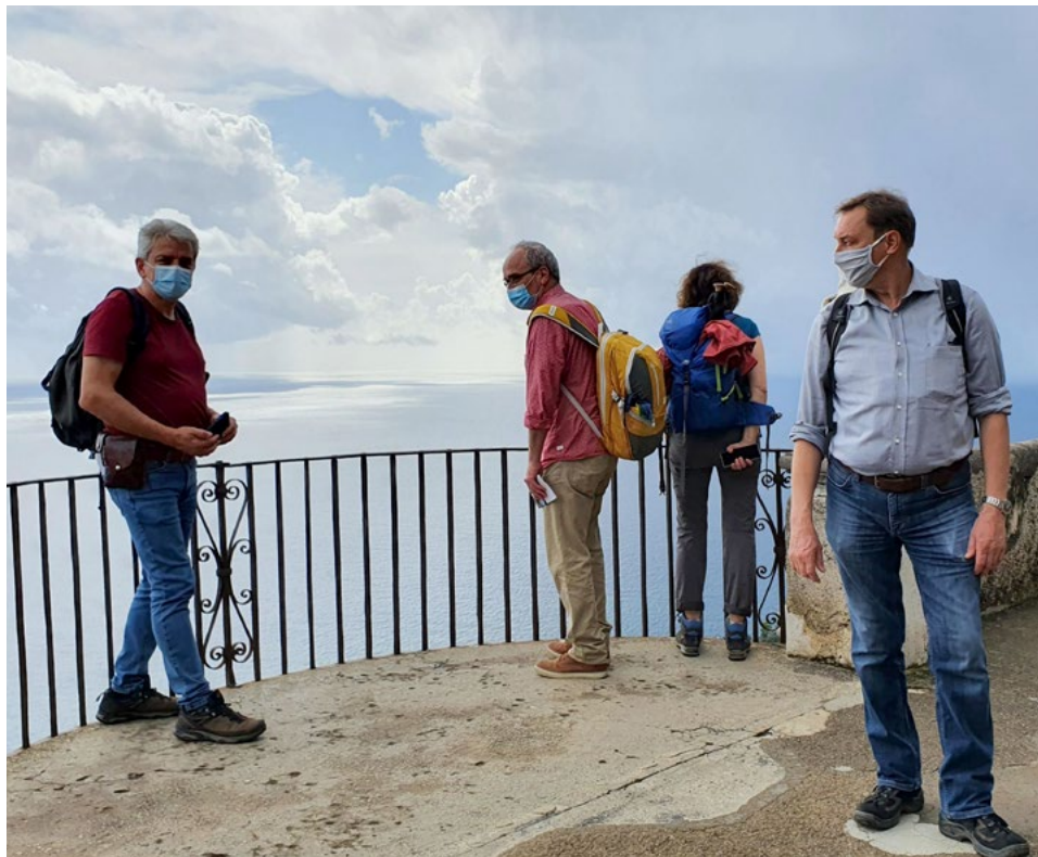
Wanderwoche in Praiano an der Amalfiküste