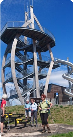
Aussichtsplattform Noahs Segel, Rhön