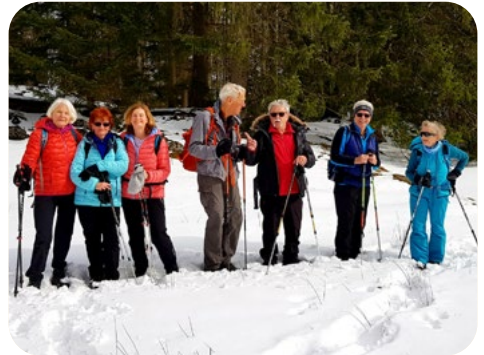
Winterwanderung Salober Alm, Ostallgäu