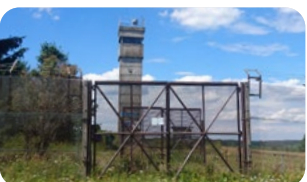
Mahnmal, ehemalige innerdeutsche Grenze, Rhön