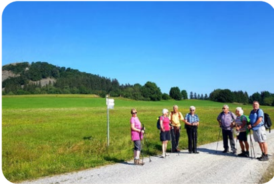
Lange Etappe zur Milseburg, Rhön