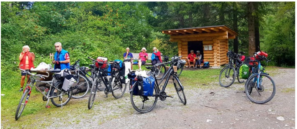
Brotzeit im Lechtal