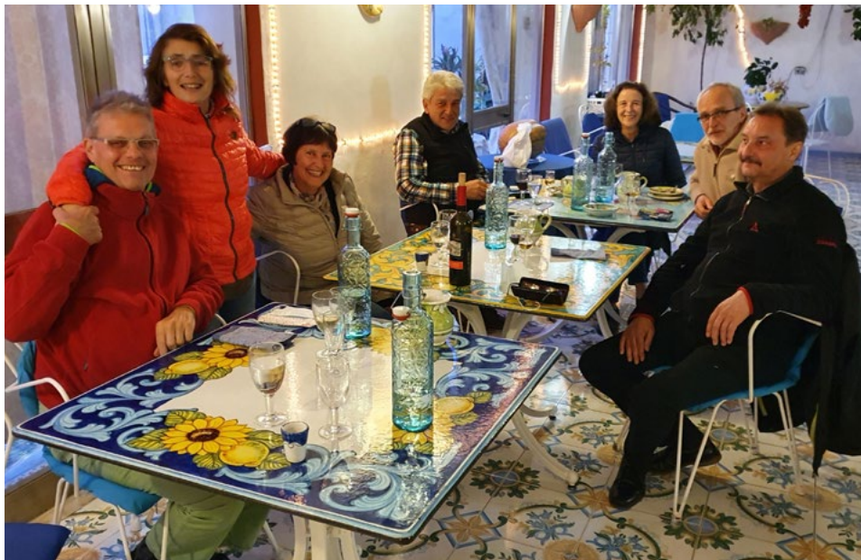
Wanderwoche in Praiano an der Amalfiküste