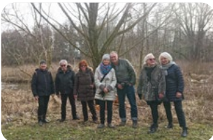
Paardurchbruch bei Ottmaring