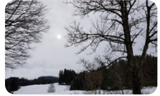
Mystisches Geizenmoos, Ammergebirge