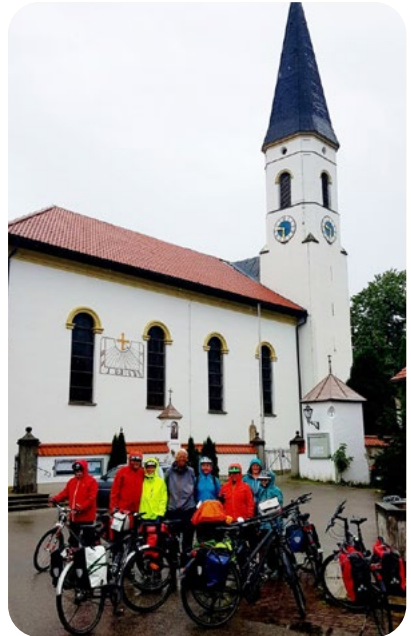
Abfahrt bei Regen in Trauchgau