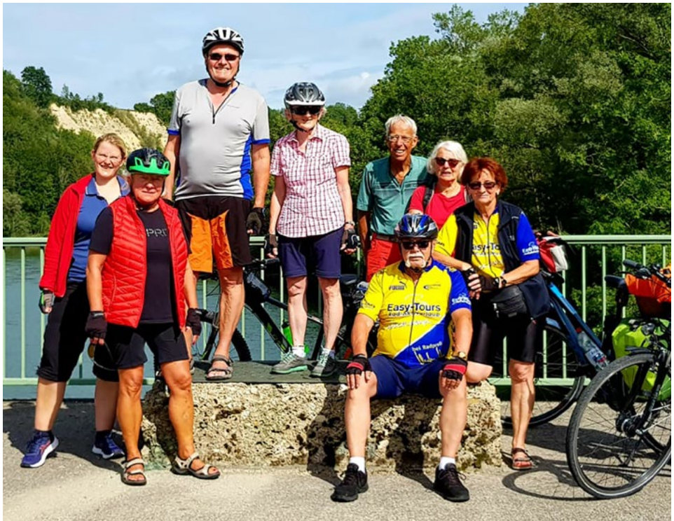
Lechschleife bei Epfach