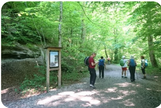
Maisinger Schlucht, Fünfseenland