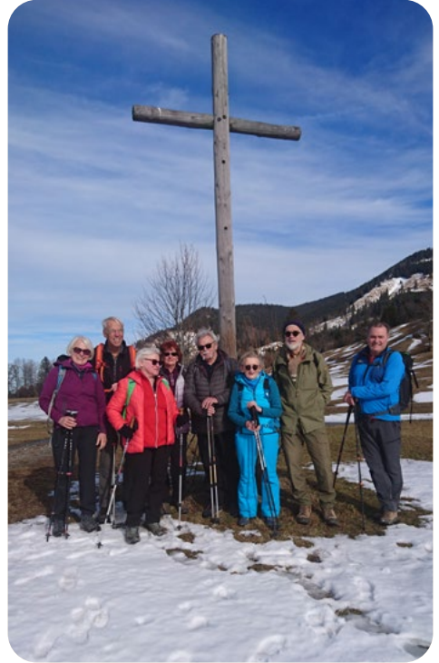
Altherrenweg bei Oberammergau