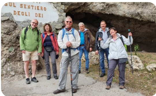
Wanderwoche in Praiano an der Amalfiküste