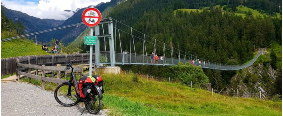
Hängebrücke bei Holzgau