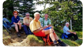
Auf dem Piesenkopf, Oberallgäu