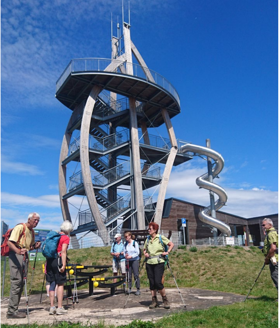
Aussichtsplattform Noahs Segel, Rhön