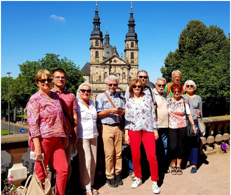
Stadtführung in Fulda