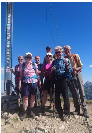
Krinnenspitze, Tannheimer Berge

Die Fachgruppenleitung wünscht allen Bergfreunden ein erfolgreiches und unfallfreies Bergsteigerjahr 2021.