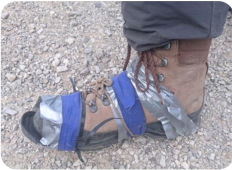
Dank Pannentape Bergtour gelungen