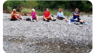
Pause am Lech