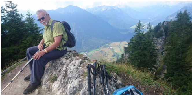
Blick vom Laber bei Oberammergau

ACHTUNG: Bei Teilnahme an einer Tour werden der Treffpunkt sowie die Möglichkeit einer Mitfahrt mit dem zuständigen Tourenleiter bzw. dessen Stellvertreter persönlich oder telefonisch abgesprochen. Bei schlechtem Wetter unbedingt telefonisch erkundigen, ob die Tour stattfindet.