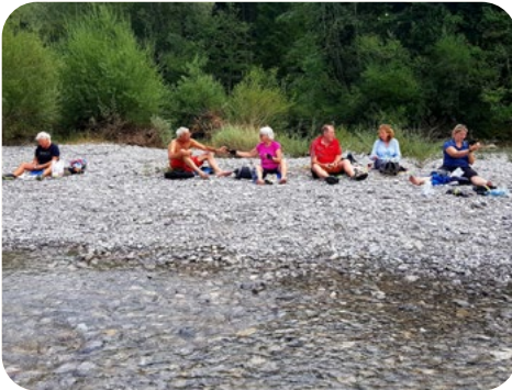
Pause am Lech