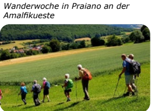
Die Rhön, Land der weiten Fernen