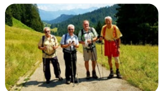
Herrenrunde am Piesenkopf, Oberallgäu

Erst wenn der letzte Baum gerodet, der letzte Fluss vergiftet, der letzte Fisch gefangen, werdet ihr feststellen, dass man Geld nicht essen kann.