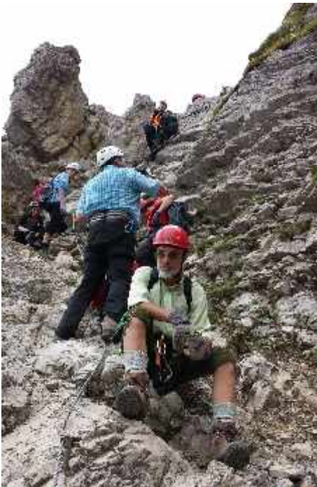
Salewa-Klettersteig im September 2014