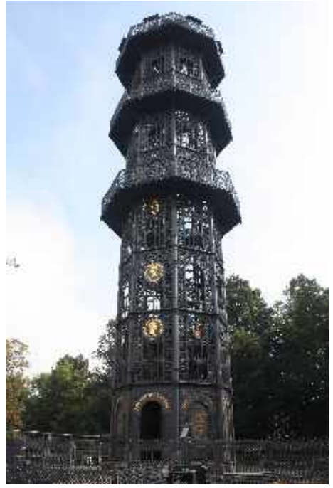
Gusseisener Turm (Löbauer Berg) im September 2014