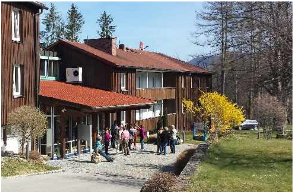
Umweltseminar „Alpen im Stress“ in der Georg-von-Vollmar-Akademie (Kochel) im März 2014