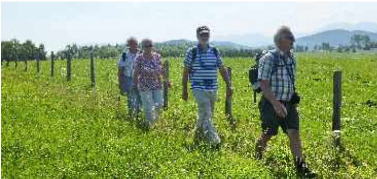
Rundwanderung in Seeg im Juni 2014