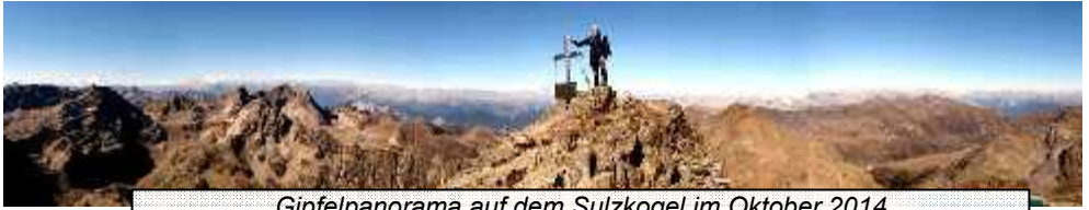
Gipfelpanorama auf dem Sulzkogel im Oktober 2014