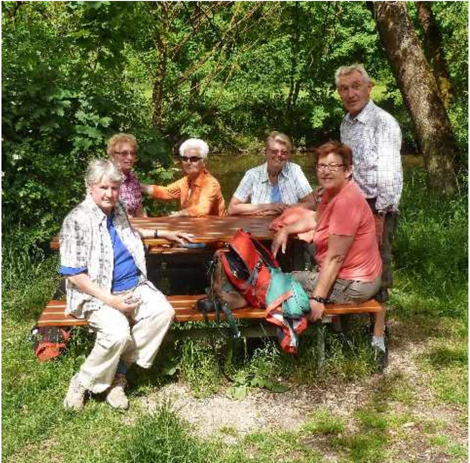
Rast auf dem Altmühl-Panoramaweg bei Pappenheim im Mai 2014