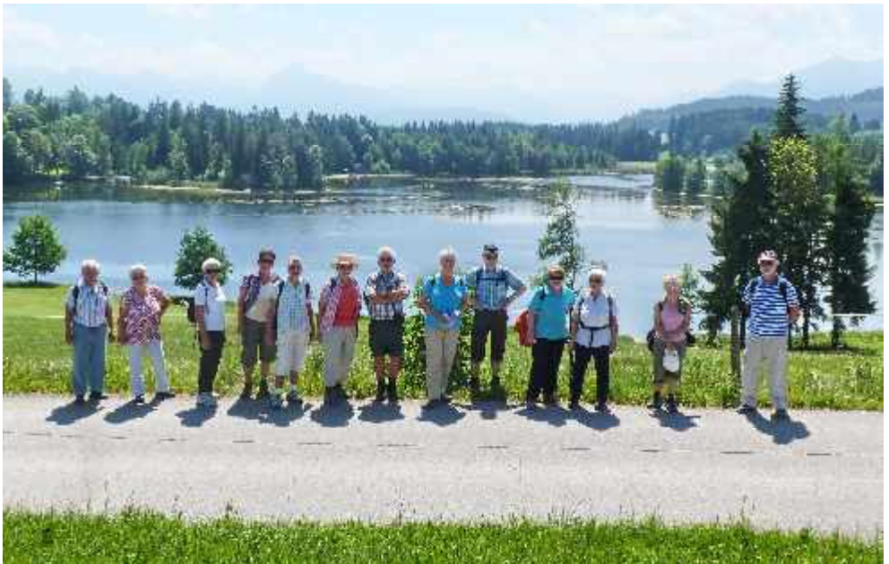
Rundwanderung in Seeg im Juni 2014