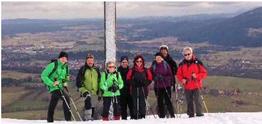
Gemeinsame Schneeschuhtour zum Blomberg mit der OG Gersthofen

ACHTUNG: Bei Teilnahme an einer Tour werden der Treffpunkt sowie die Möglichkeit einer Mitfahrt mit dem zuständigen Tourenleiter bzw. dessen Stellvertreter persönlich oder telefonisch abgesprochen. Bei schlechtem Wetter unbedingt telefonisch erkundigen, ob die Tour stattfindet.