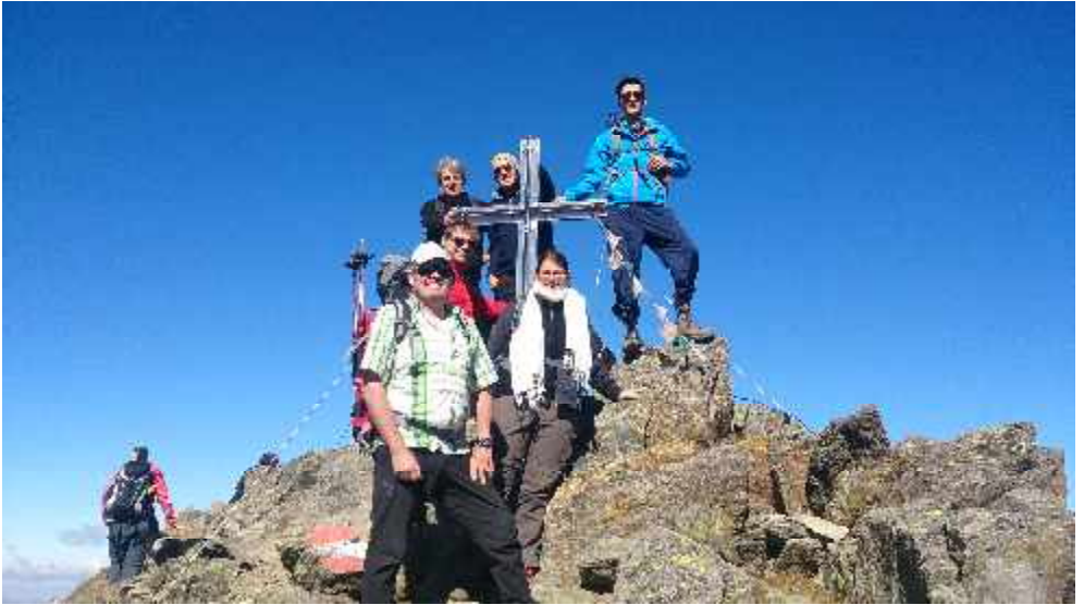
Von Kühtai auf den Sulzkogel im Oktober 2014