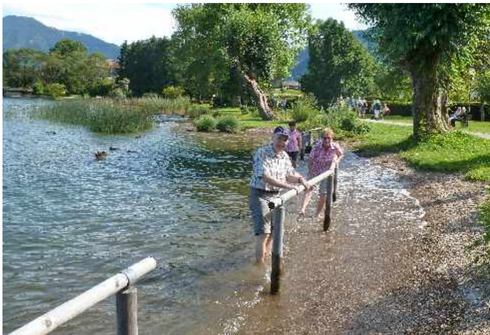
Wanderung am Tegernsee im August 2014

Die Ehrung der Jubilare und Geburtstagskinder findet auf der Jahresabschlussfeier am 29. November 2015 im Vereinslokal statt.