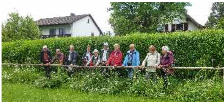
Wanderung zur Schatzbergalm im Mai 2014