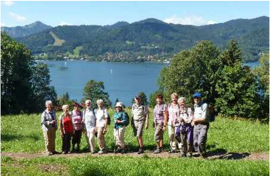
Wanderung am Tegernsee im August 2014