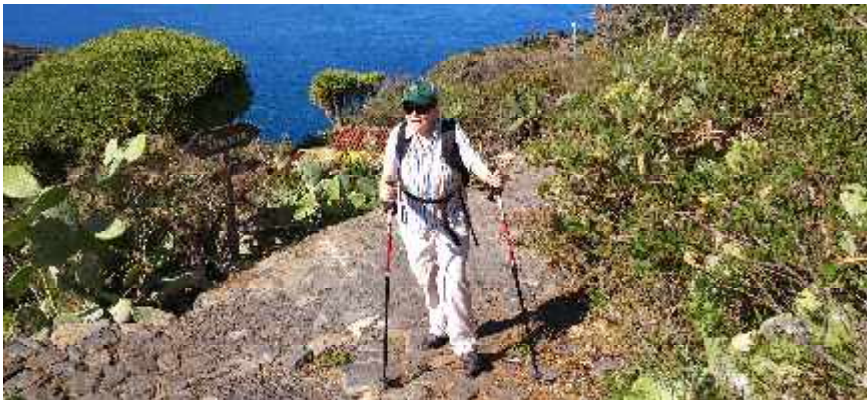
Winterwandern auf der Kanareninsel La Palma