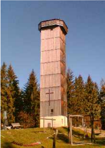
Aussichtsturm auf dem schwarzen Grat