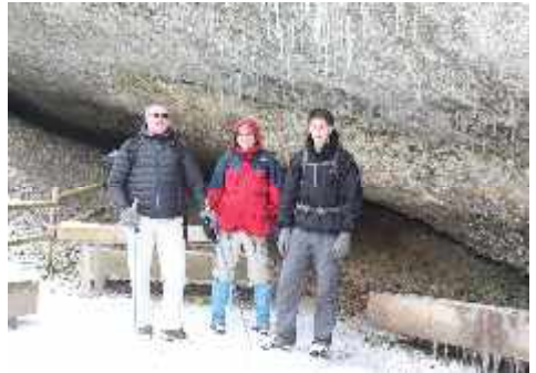
Wanderung Eistobel im Januar 2013