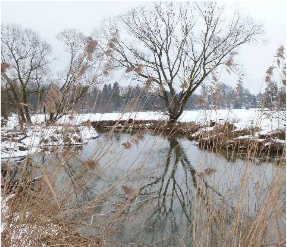
Winterwanderung im Schmuttertal im Februar 2013