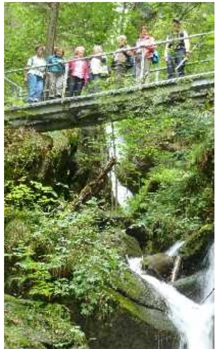
Naturfreunde in Fischen: Wanderung zu den Hinanger Wasserfällen im September 2013