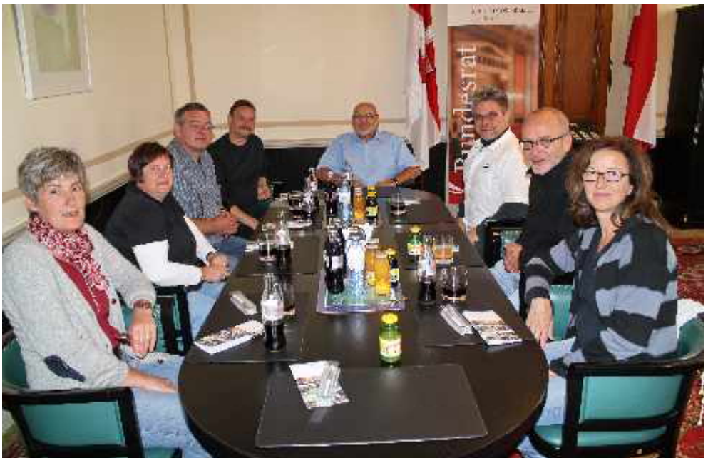
Empfang beim Bundesratspräsidenten der Republik Österreich während dem KultUrlaub im September 2013