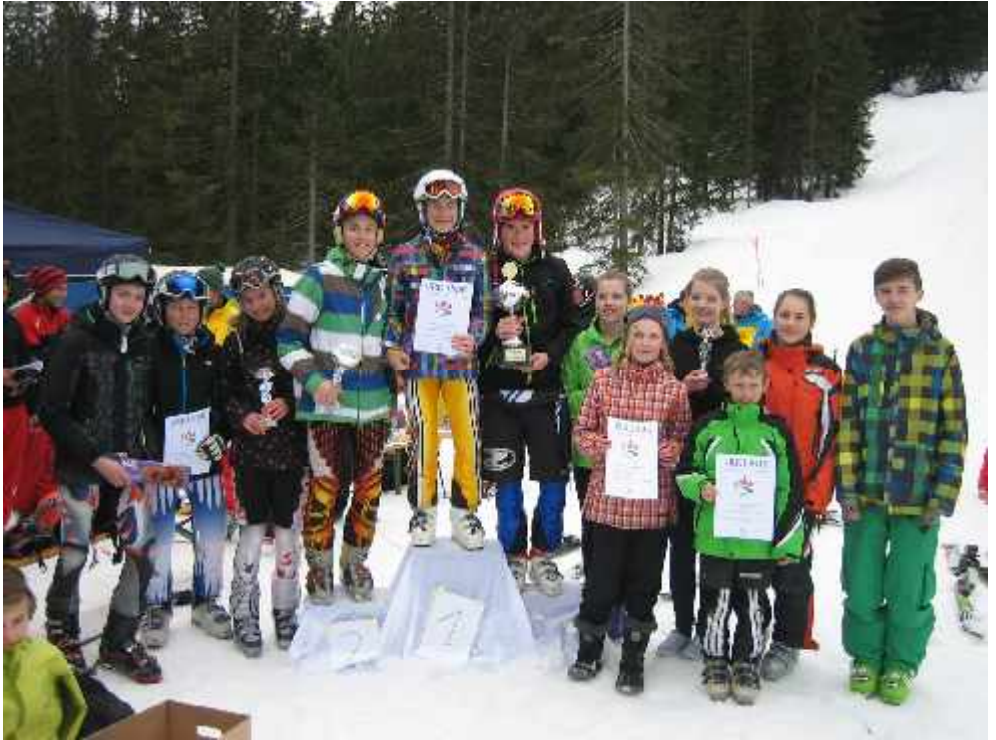
Naturfreunde Bezirksmeisterschaft 2013