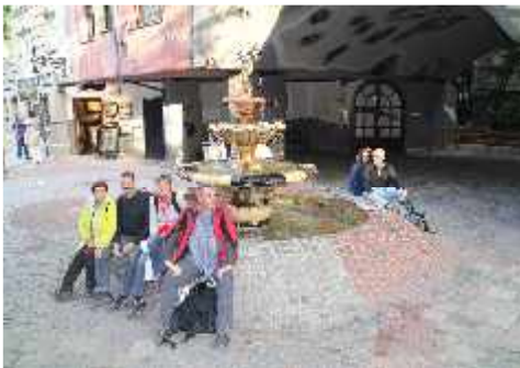
KultUrlaub Wien – Vor dem Hundertwasserhaus