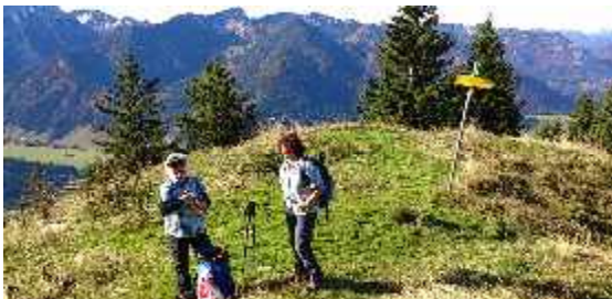
Blick vom Schweinsberg ins Leitzachtal

Alle Schneeschuhtouren können auch als Skitouren durchgeführt werden. Alpinski fahren ist ebenfalls möglich, da in der Nähe der Ausgangspunkte Skilifte vorhanden sind.