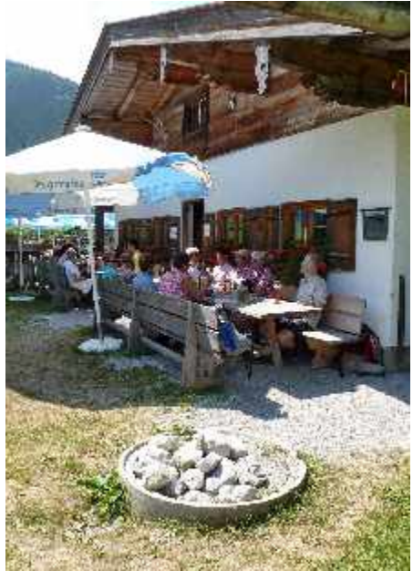
Wanderung am Tegernsee zum 'Bauer in der Au'