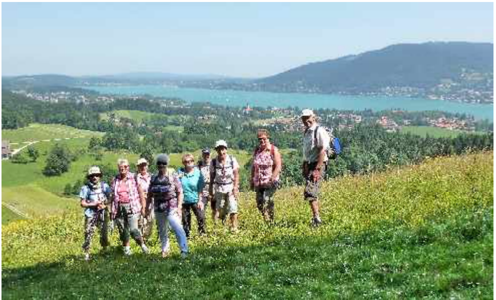
Wanderung am Tegernsee zum 'Bauer in der Au' im Juli 2013