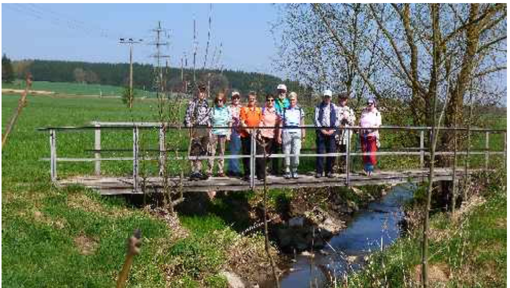
Wanderung nach Harthausen im April 2013