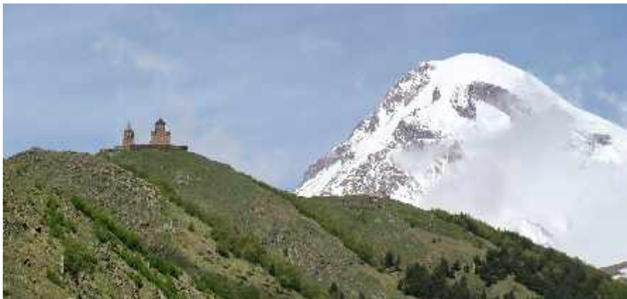
Kaukasusgigant Kaszbek, 5033 m, Georgien

ACHTUNG: Bei Teilnahme an einer Tour werden der Treffpunkt sowie die Möglichkeit einer Mitfahrt mit dem zuständigen Tourenleiter bzw. dessen Stellvertreter persönlich oder telefonisch abgesprochen. Bei schlechtem Wetter unbedingt telefonisch erkundigen, ob die Tour stattfindet.