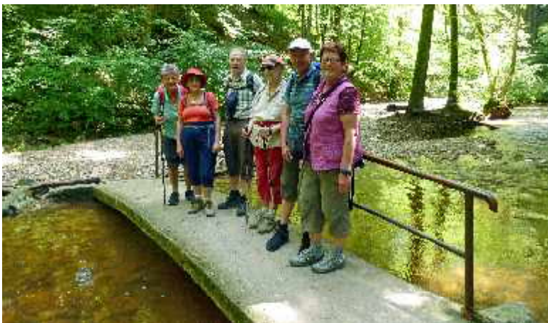
Maisinger Schlucht im Juni 2013