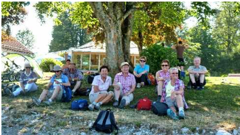
Wanderung am Tegernsee zum 'Bauer in der Au' im Juli 2013

Die Ehrung der Jubilare und Geburtstagskinder findet auf der Jahresabschlussfeier am 30. November 2014 im Vereinslokal statt.