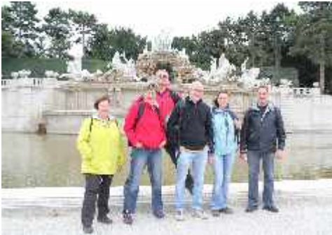
KultUrlaub Wien - Neptunbrunnen bei Schönbrunn