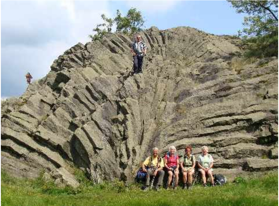
Basaltfächer auf dem Hirtstein, Erzgebirge