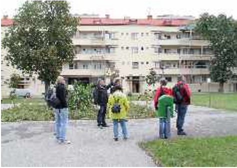
KultUrlaub Wien Sep. 2013 – Führung „Das Rote Wien“