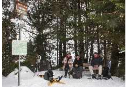
Wanderung Eistobel auf der Kugel im Januar 2013