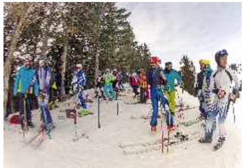
Beim Stangentraining im Januar 2013