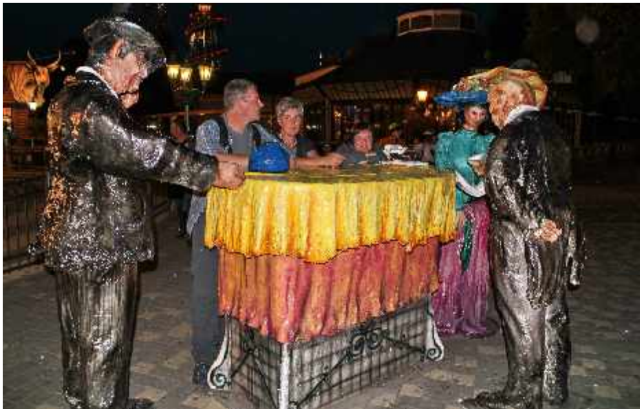
KultUrlaub Wien – Nachts auf dem Prater

Auch im Jahre 2014: Deine Freizeit mit den