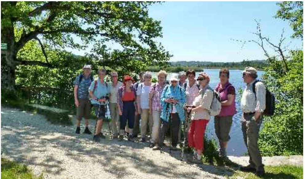
Maisinger Schlucht im Juni 2013