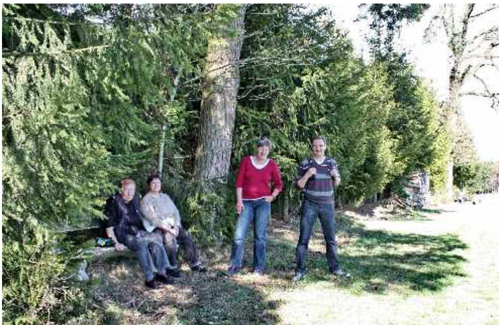
Geologischer Lehrpfad bei Bonstetten im April 2013