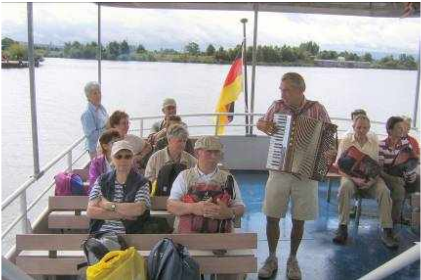
Wanderung und Bootsfahrt am Altmühlsee im August 2008