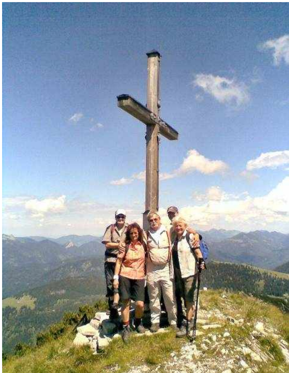
Gipfelgück auf dem Demeljoch im Isarwinkel