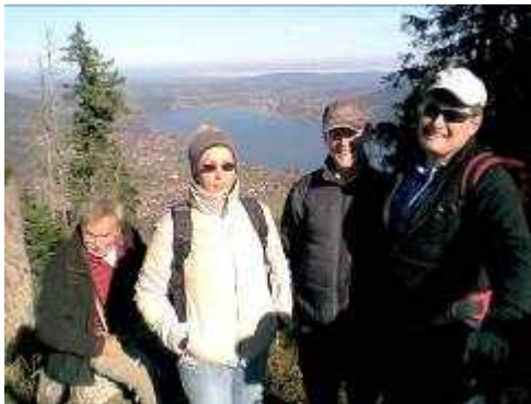
Glücksmomente bei der Jahresabschluss tour auf den Ringspitz mit Blick auf den Tegernsee

ACHTUNG: Bei Teilnahme an einer Tour werden der Treffpunkt sowie die Möglichkeit einer Mitfahrt mit dem zuständigen Tourenleiter bzw. dessen Stellvertreter persönlich oder telefonisch abgesprochen. Bei schlechtem Wetter unbedingt telefonisch erkundigen, ob die Tour stattfindet.