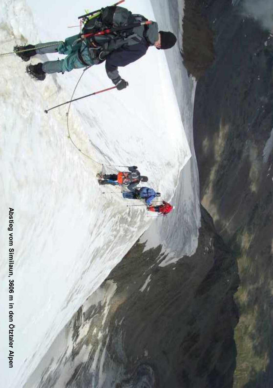
Abstieg vom Similaun, 3606 m in den Ötztaler Alpen