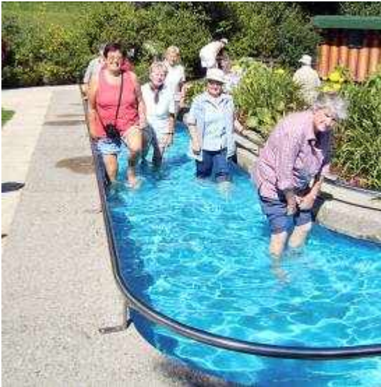
Wohltuende Kneipp-Engel bei einer Wanderung im Hintersteiner Tal

Wir haben für 2009 eine Änderung von Zeitpunkt und Räumlichkeit für unsere monatlichen Zusammenkünfte beschlossen!