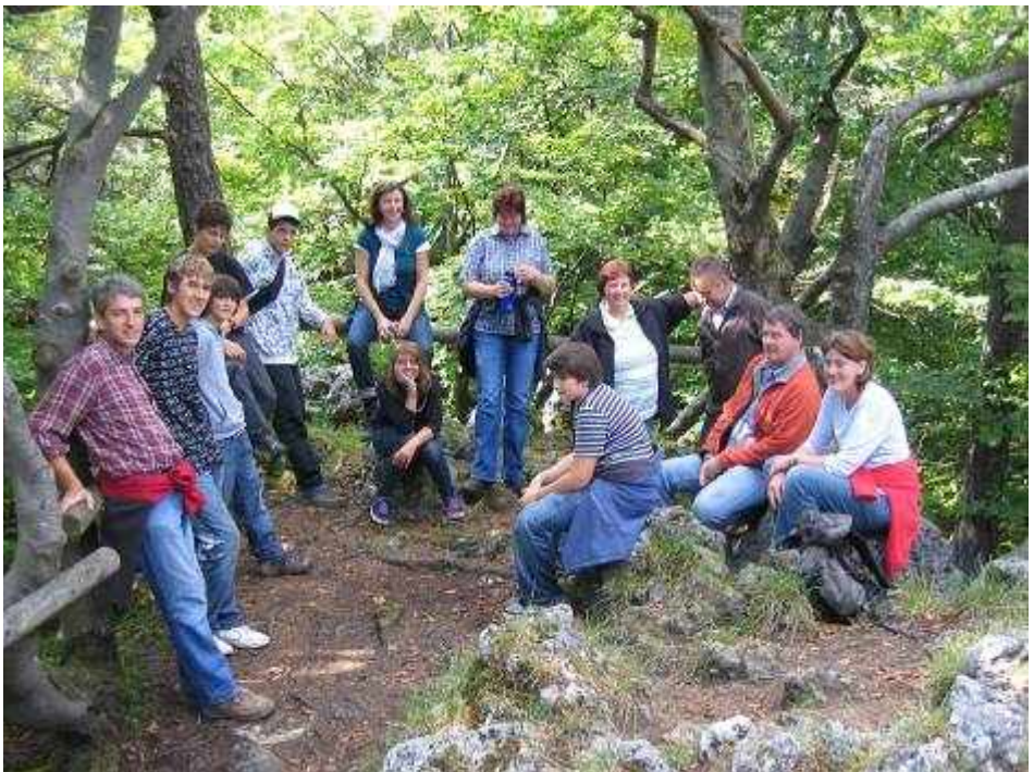
Wanderung über den Eibengrät bei Spies in der Fränkischen Schweiz im September 2008