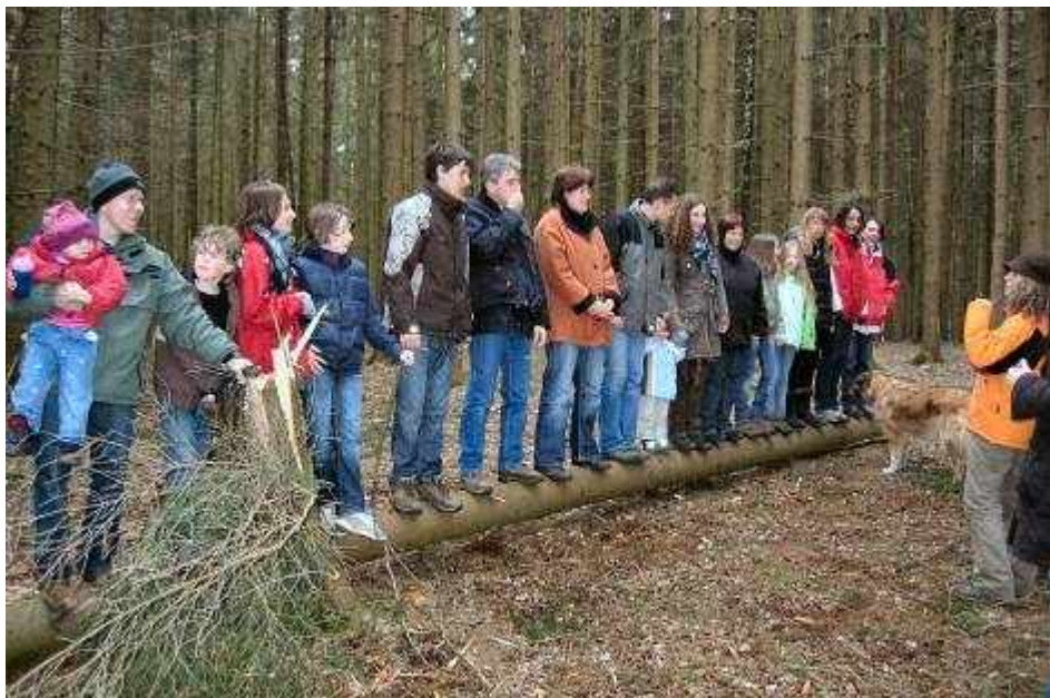
„Leute sortieren auf Baumstamm ohne herunterfallen“ bei unserem Umweltseminar im April 2008