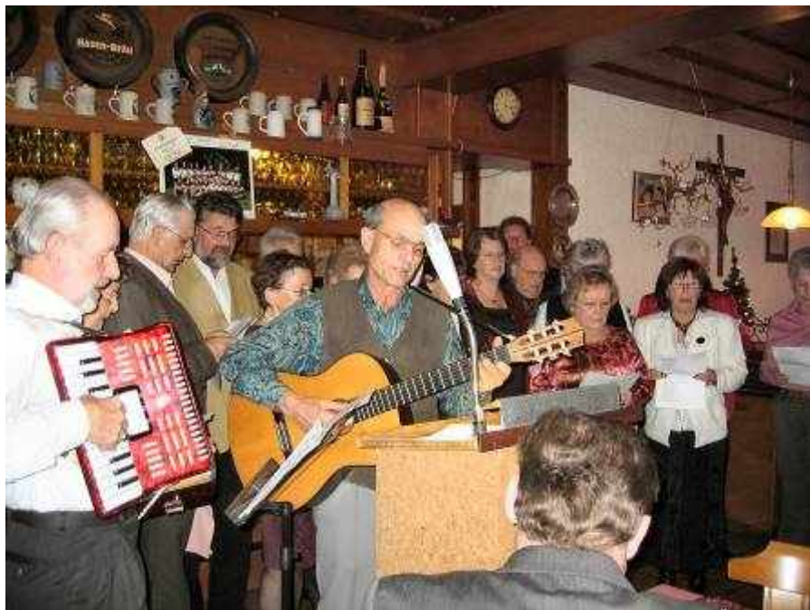
Musikalische Unterhaltung bei der Jahresschlussfeier 2007