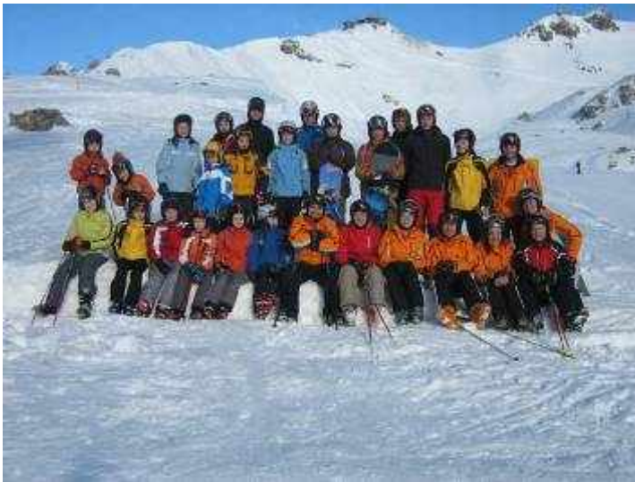
Jugendtraining am 19./20.01.2008 in Grasgehren und am Nebelhorn, Übernachtung im Sportleistungszentrum in Oberstdorf