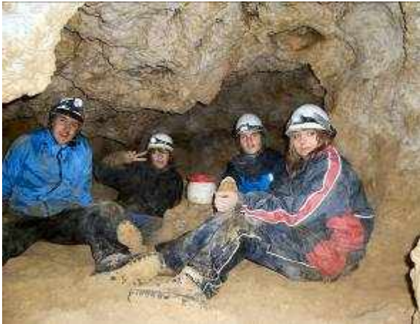
Höhlenbuch erfolgreich gefunden und was reingeschrieben!