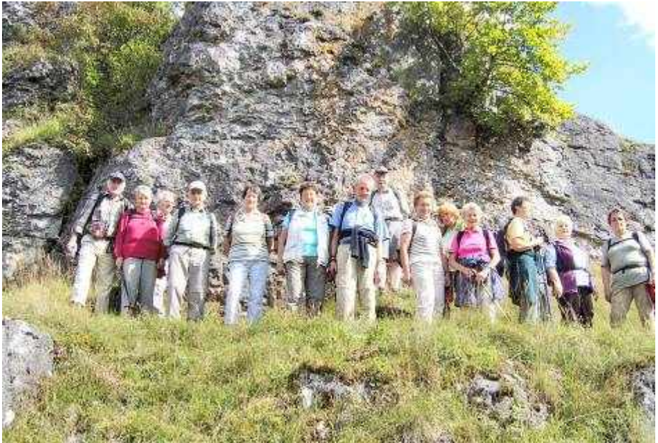
Wanderung auf dem Altmühltal-Panoramaweg von Pappenheim nach Sönhofen im August 2008