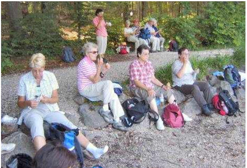
Rast während einer Wanderung um den Alpsee im Juli 2008