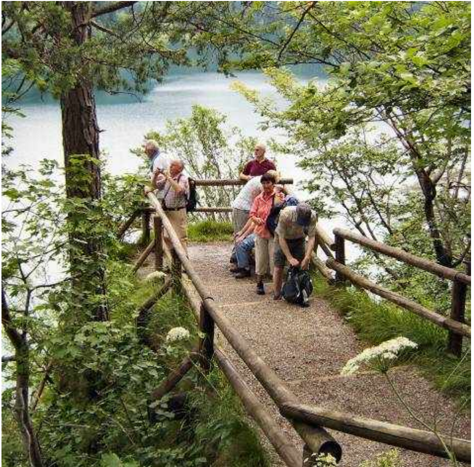
Wanderung vom Lechfall zum Alpenrosenweg, um den Alpsee u. durchs Naturschutzgebiet Schwannsee (Juli 2008)