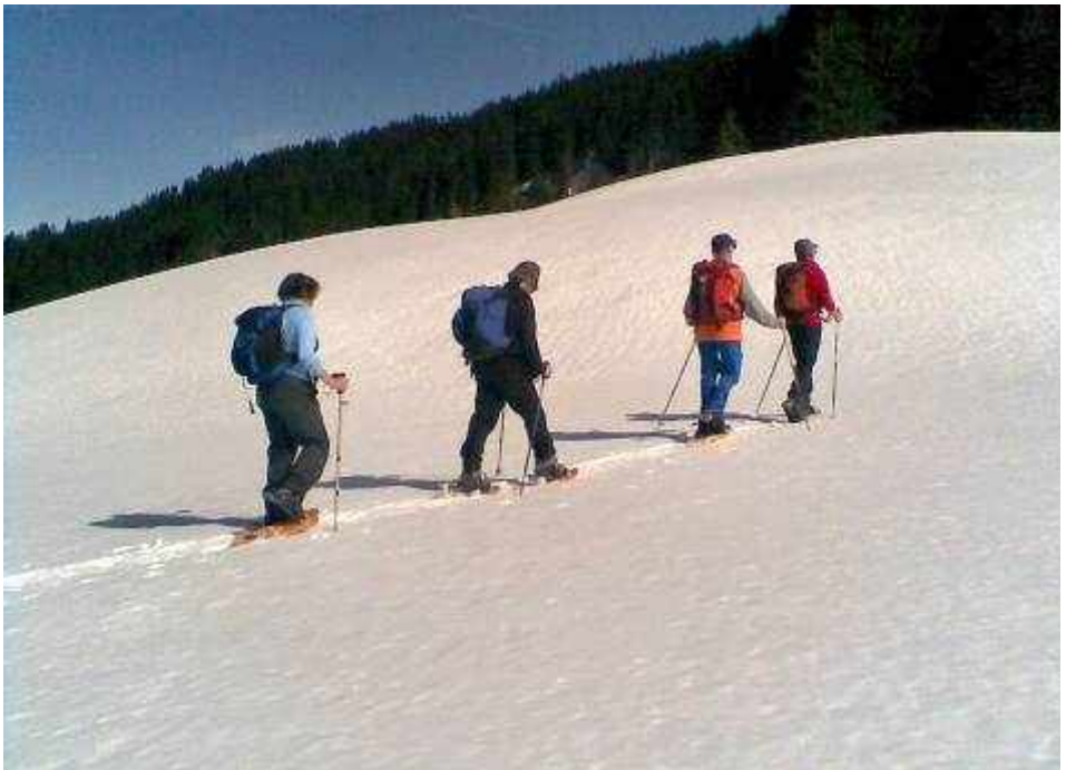
Sonne und Schneeschuhe - auf dem Weg zum Hochschelpen bei Balderschwang

Alle Schneeschuhtouren können auch als Skitouren durchgeführt werden. Alpinskifahren ist ebenfalls möglich, da in der Nähe der Ausgangspunkte Skilifte vorhanden sind.