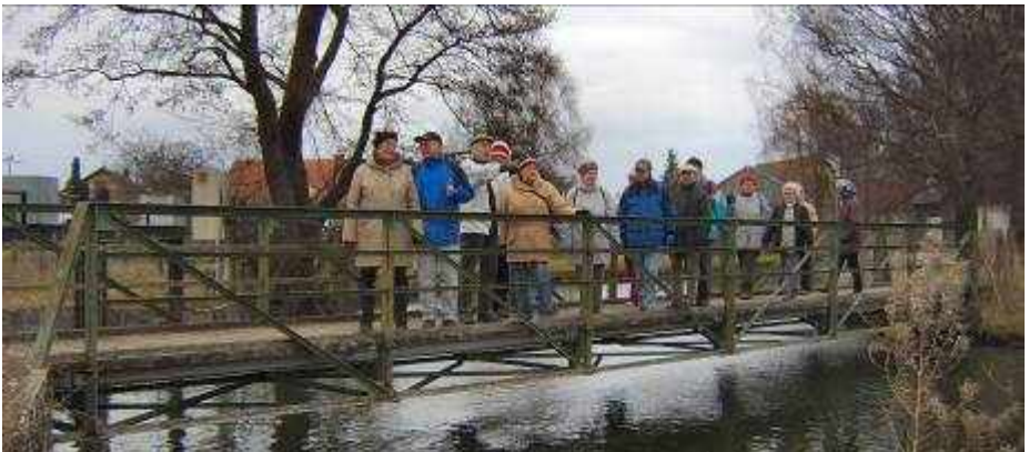
Naturfreunde unterwegs – Wanderung bei Kissing