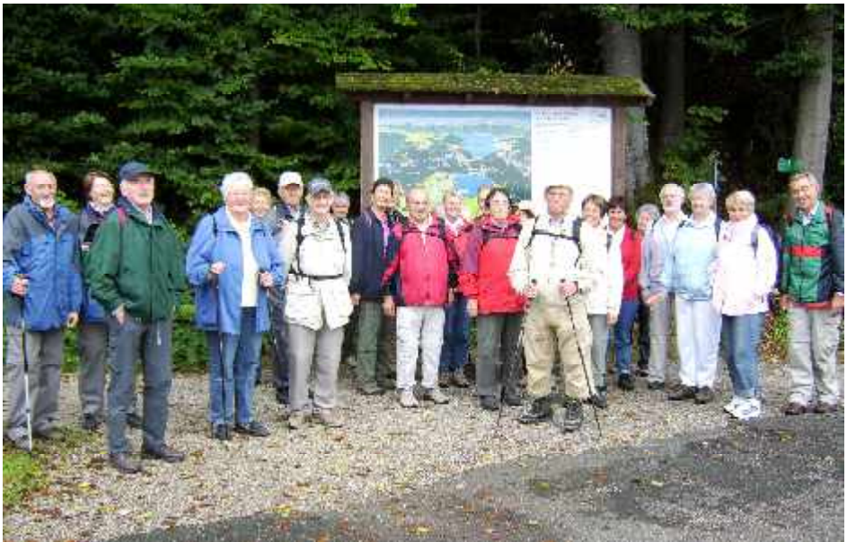
Wanderung in Kochel