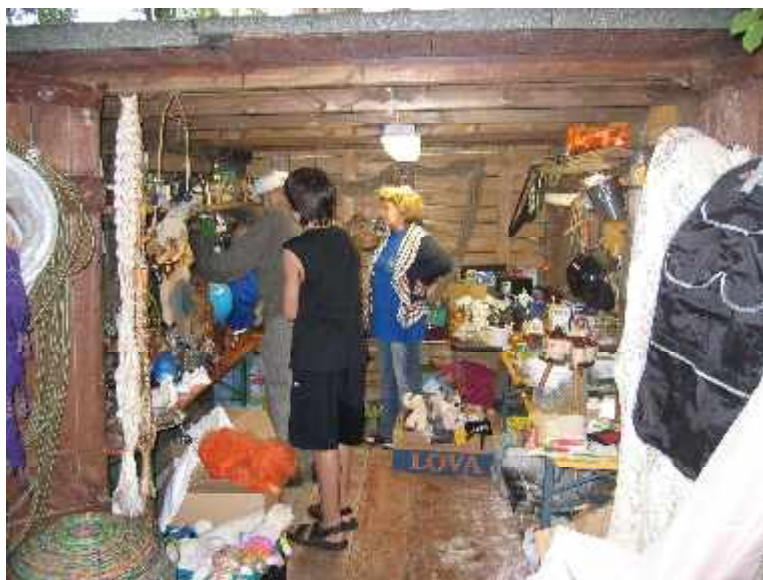
Shoppen im Schuppen – Zünftiger Flohmarkt beim Tag der Familie