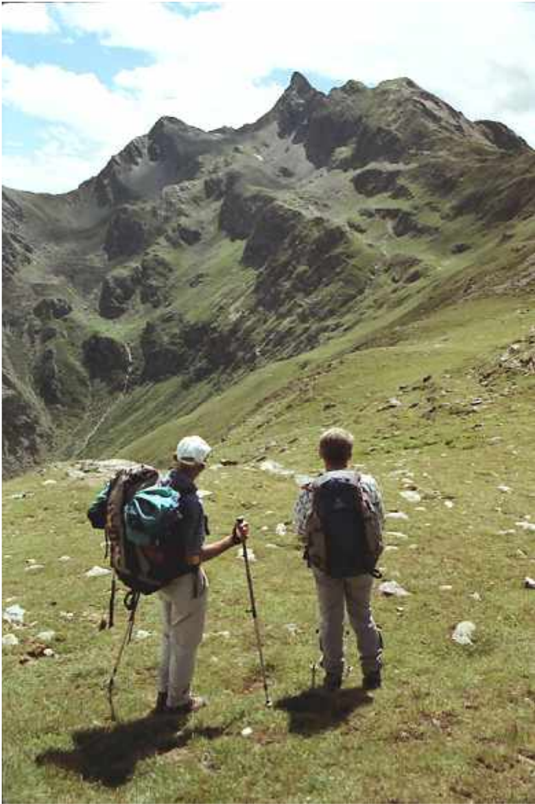
Sarntaler Höhenweg, Blick zurück zum Weißhorn

Auch im Jahre 2008: Deine Freizeit mit den Naturfreunden