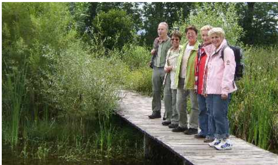
Wanderung in Kochel