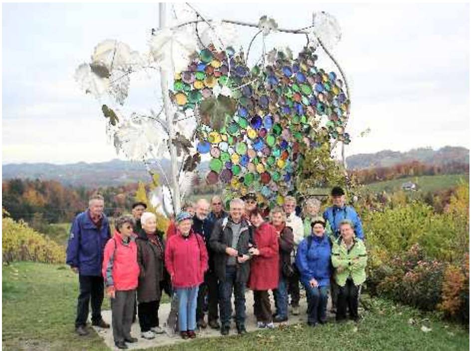
Glanzer Weintraube – die größte Weintraube der Welt an der Südsteirischen Weinstraße