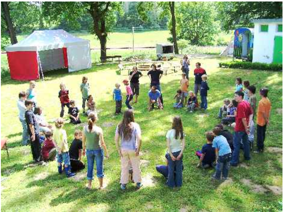
Kinderpfingstcamp 2007 des Landesverbandes der Naturfreundejugend auf dem Gründlmooshaus