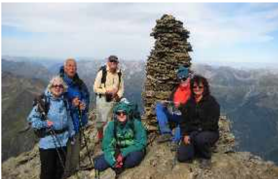
Geschafft! Auf der Riffelspitze im Verwallgebirge

ACHTUNG: Bei Teilnahme an einer Tour werden der Treffpunkt sowie die Möglichkeit einer Mitfahrt mit dem zuständigen Tourenleiter bzw. dessen Stellvertreter persönlich oder telefonisch abgesprochen. Bei schlechtem Wetter unbedingt telefonisch erkundigen, ob die Tour stattfindet.