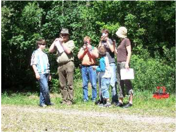
Orientierungs- wanderung in der Kissinger Teichlandschaft